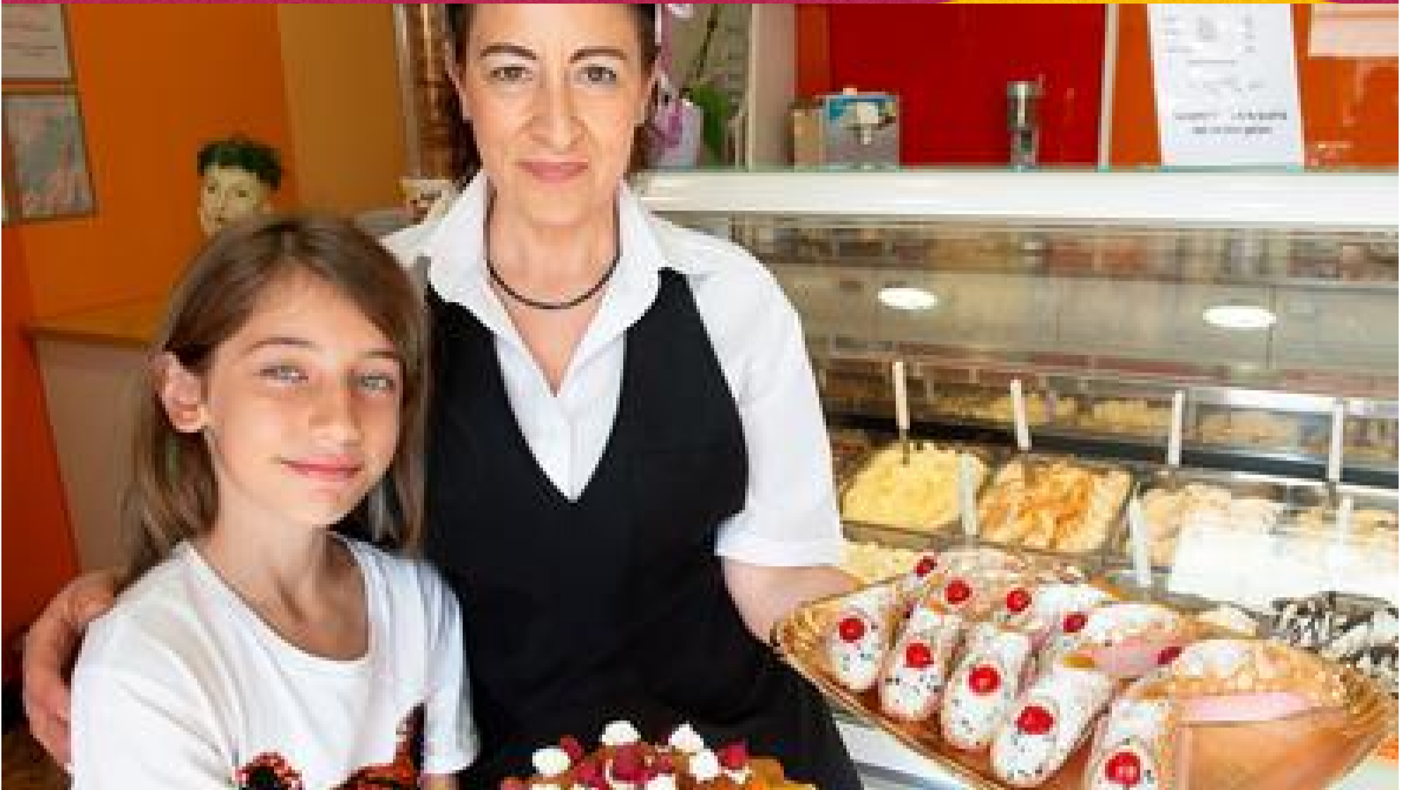
Tutti pazzi per Angelina. Suo il gelato che prende la Valpantena per la gola